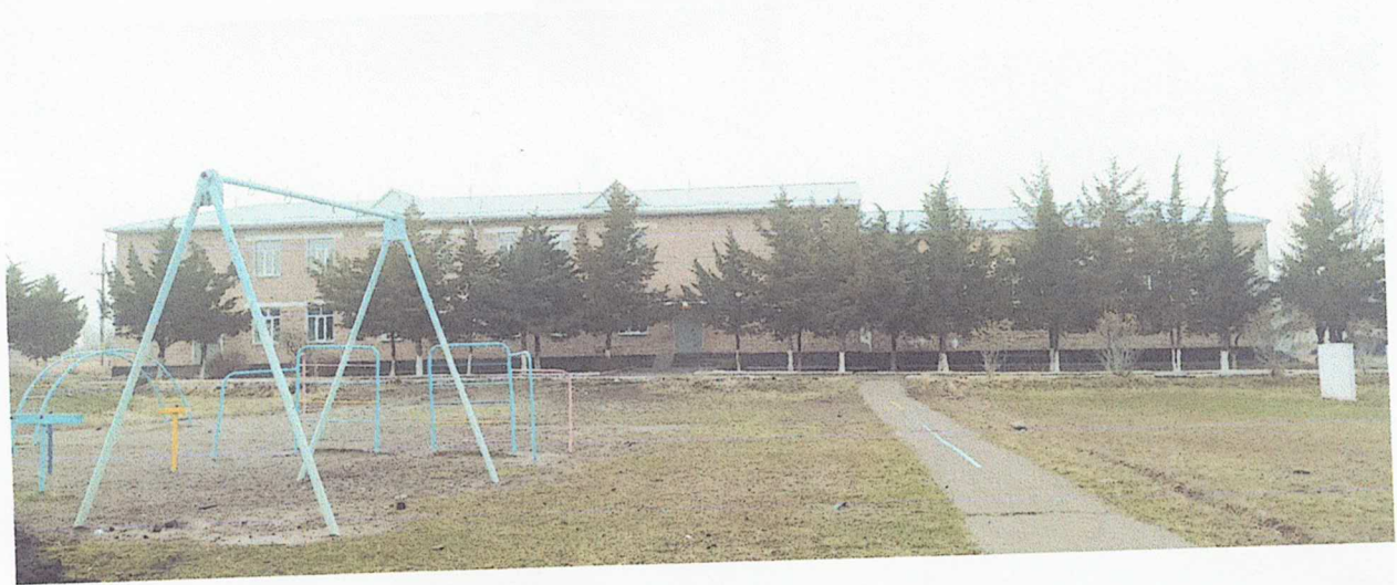
Южная сторона школы